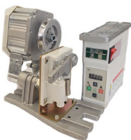
MOTOR SERVO AHORRADOR